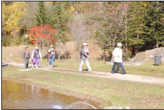
水源公園を歩く参加者