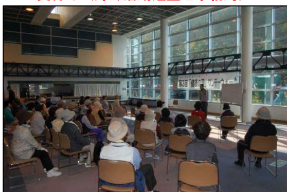
斎川先生によるウォーキングアドバイス