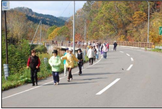
スタート直後（温泉裏）