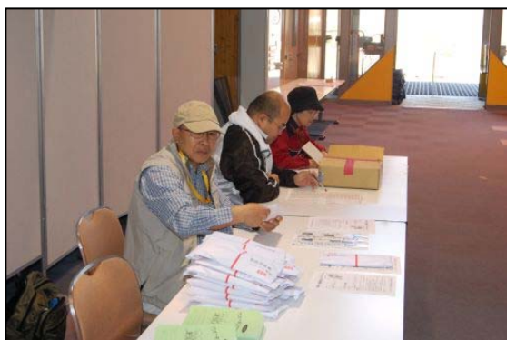
受付(野外活動連盟と事務局)