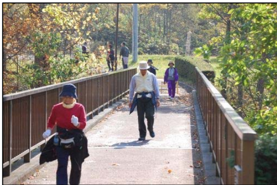
日本庭園（野鳥の橋）