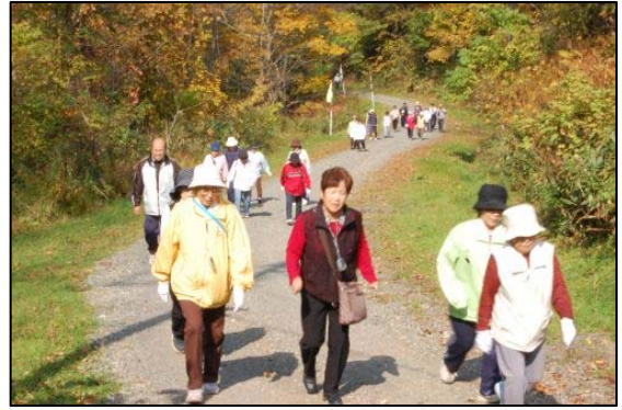
水源公園へ向かう道のり