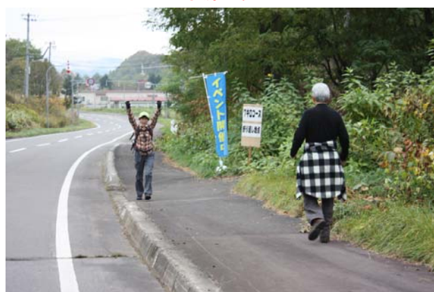
7キロ折り返し地点