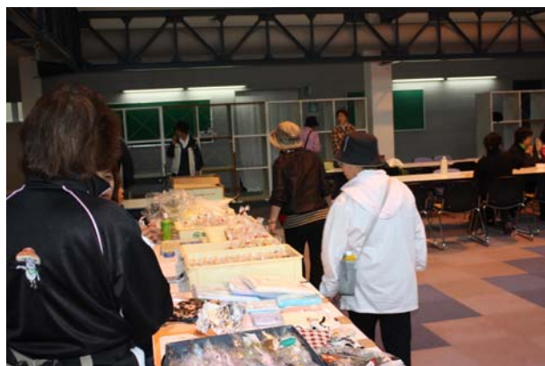
各種販売（エルムの里、くるみ会、もってけ市）