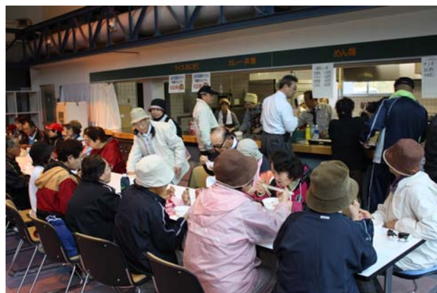
昼食（きのこ汁・おにぎり・ザンギ等販売）