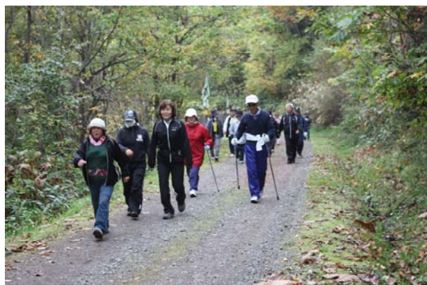
水源公園までの道