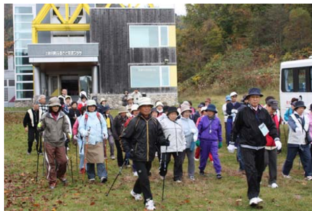
スタート直後（ロッジ前）