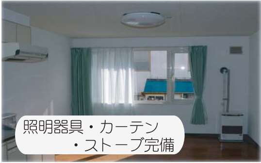
照明器具・カーテン ・ストーブ完備