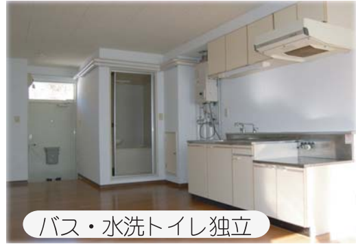
バス・水洗トイレ独立