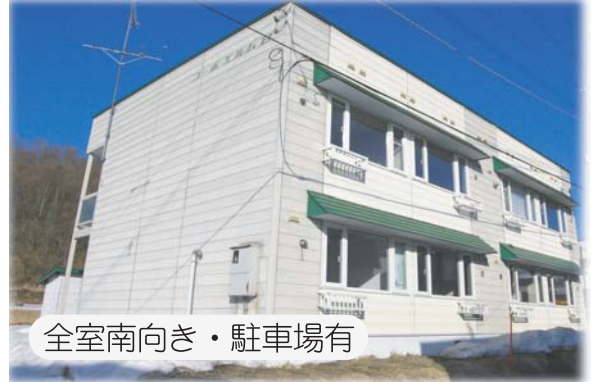
全室南向き・駐車場有