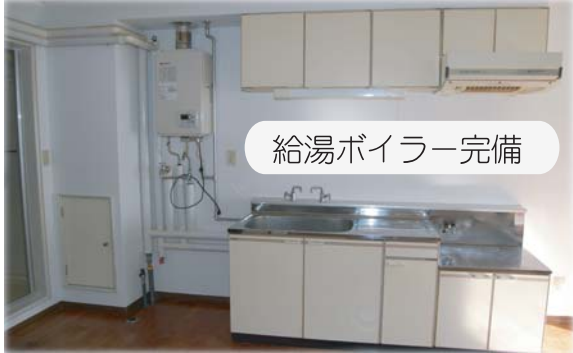
給湯ボイラー完備