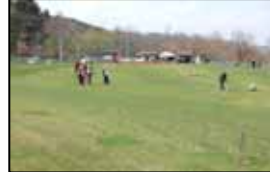
奥沢パークゴルフ場