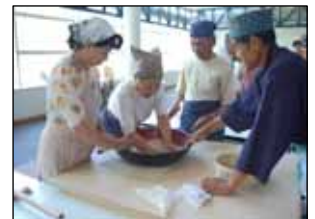
そば打ち体験教室

また、本町は緑豊かな山に囲まれていることから、1年を通じてわらびやふき、きのこなどの山菜が近くの山で採取することもできます。