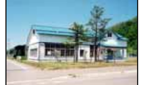
旧上砂川駅舎(悲別駅)