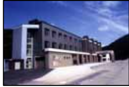
上砂川岳温泉「パンケの湯」