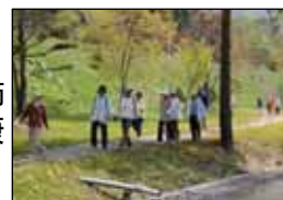
ウォーキングイベント

本町では、町民誰もが健康で安心して生活を送ることができるよう「医師による健康づくり講演会」や「健康相談」、「ウォーキングイベント」など、健康に関する様々な健康づくり事業を温泉などにおいて随時行っています。